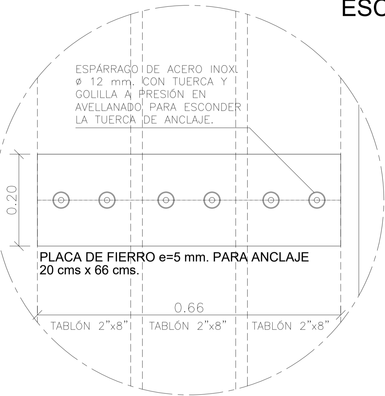
PLANTA PLACA TIPO 01 DETALLE "X" PARA PLACA DE ANCLAJE TIPO 01 TABLONES. ESC 1 : 5