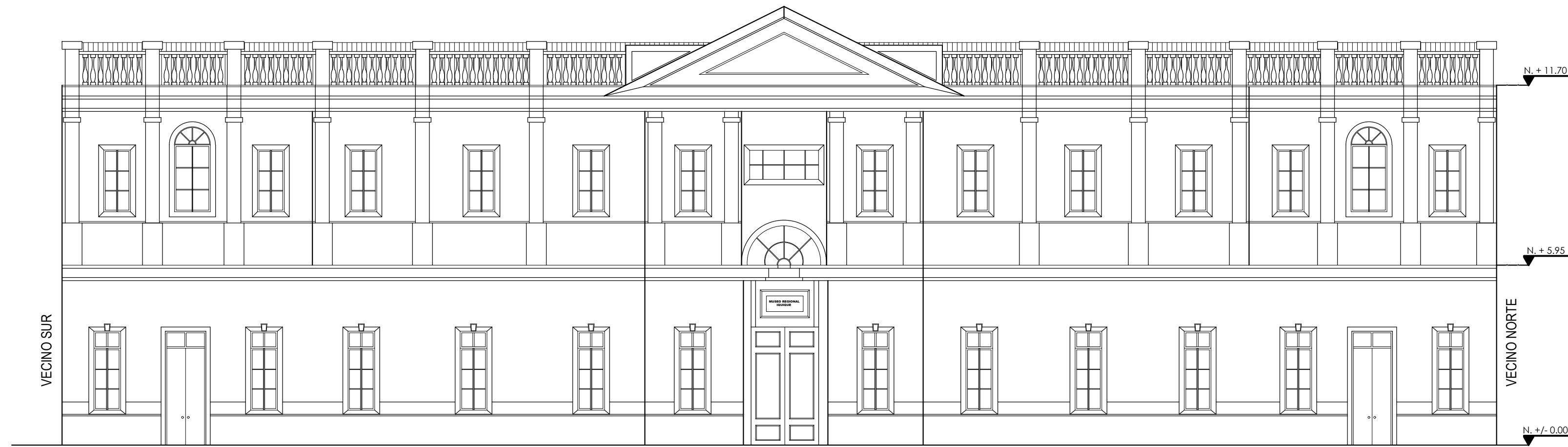
ELEVACIÓN FRONTAL - PASEO PEATONAL BAQUEDANO ESC. 1/120