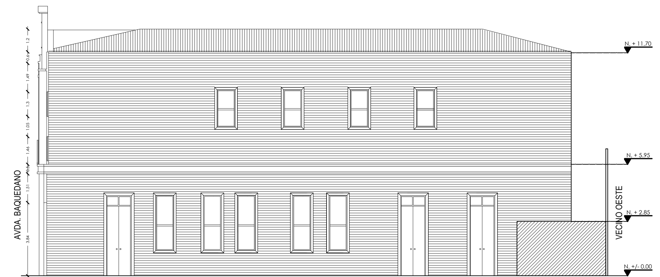
ELEVACIÓN LATERAL - NORTE ESC. 1/120