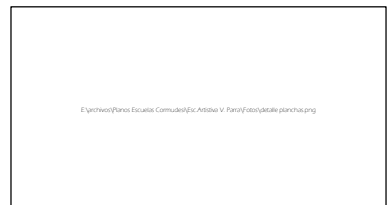
DETALLE PASILLO TECNICO SUPERIOR.