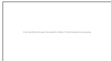
VISTA DETALLE CERCHAS Y CIELO FALSO.