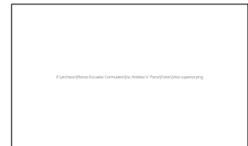
VISTA SUPERIOR TECHUMBRE Y CIELO A INSTALAR.